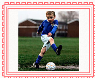
ИГРАЙ. КАК БЕКХЭМ