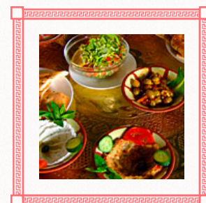
ВКУСНО. АЖ ЖУТЬ