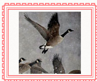
НЕ ЕШЬ МЕНЯ. Я ТЕБЕ ЕЩЕ