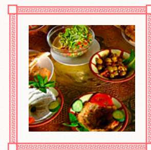
ВКУСНО. АЖ ЖУТЬ