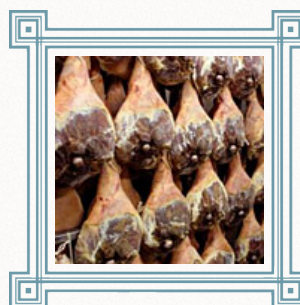
ОНИ СРАЖАЛИСЬ ЗА ОКОРОК